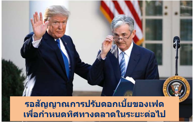
รอสัญญาณการปรับดอกเบี้ยของเฟด เพื่อกำหนดทิศทางตลาดในระยะต่อไป