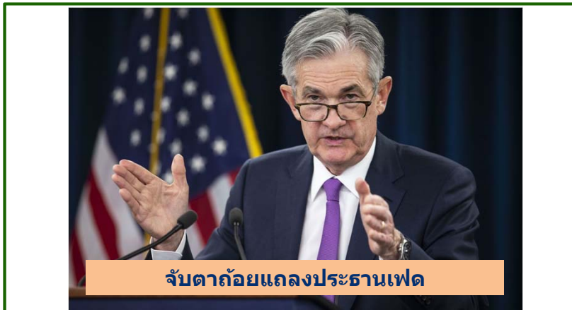
จับด่าถ้อยแถลงประธานเฟด