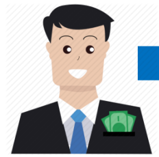
นักลงทุน